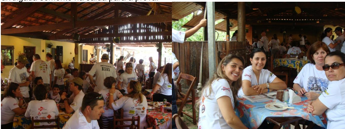
Rancho São Joaquim, Joaquim Egídio, Campinas, SP

Raid – Marcado por extrema precisão e regularidade, os competidores percorreram os caminhos da Serra das Cabras, local que apesar de conhecido, torna-se bem diferente e desafiador quando planilhado. Após 4 horas de prova, o primeiro veículo chegou ao local da confraternização, Rancho São Joaquim, restaurante localizado no Distrito de Joaquim Egídio, região de Campinas, onde os competidores, ao som dos Creuzebecks puderam saborear uma deliciosa comida feita no fogão à lenha e conferir a apuração da prova. Há que se esclarecer que o primeiro competidor a chegar, não é necessariamente o vencedor, e sim, aquele que fez o percurso com a maior regularidade possível, passando pelos Check Points com a maior proximidade ao tempo previsto, conforme planilha divulgada somente na saída para a prova.